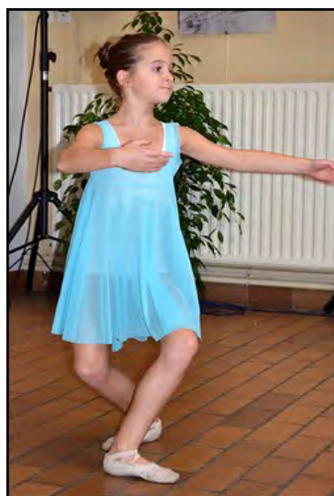
école Art et danse de Cognac