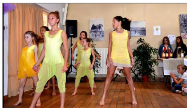
école Art et danse de Cognac