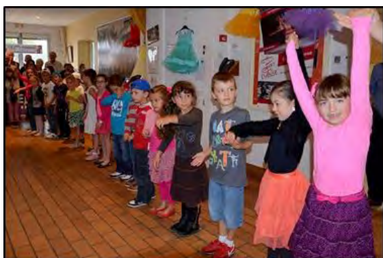
Classes de CP et CE 1 de Bou-tiers-St-Trojan (près de Cognac)

Pour cette première Fête du timbre sur le thème de la danse , les organisateurs charentais ont fait très fort ! Le spectacle était au rendez-vous ! Bravo à tous !