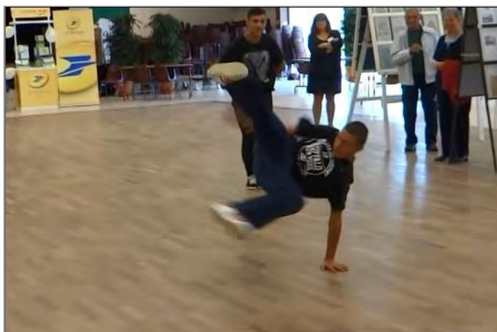
A Olonne s/mer, le dimanche matin, des jeunes ont fait une belle démonstration de danse de rue au centre de la salle.