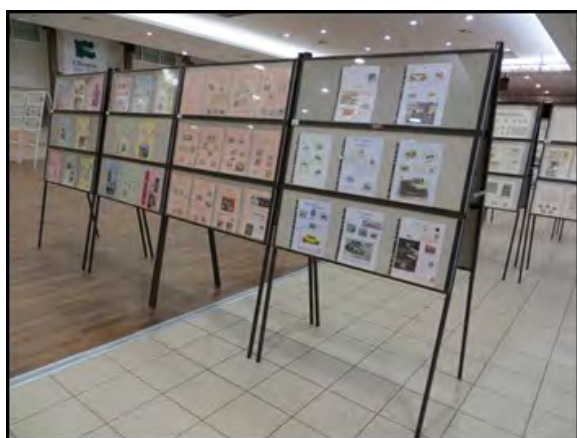
Photo 2 : une partie des collections jeunesse à Olonne