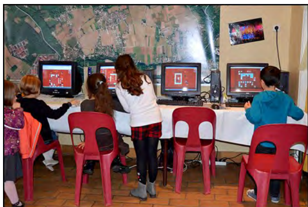
l'espace jeunesse à Boutiers

Soit au total 25 collections en championnat et 20 en débutants .