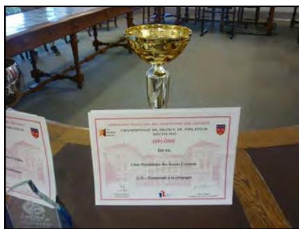
Le diplôme "promenade à la campagne" du concours national 1er ex-aequo