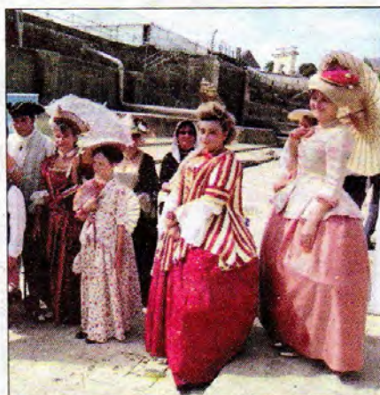
Les beaux costumes seront de sortie.

DE 10 HEURES À 19 HEURES : Campements historiques. 22 H 35 : Spectacle pyrotechnique, son et lumière