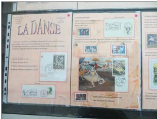
Eva SOUCHARD (La Crèche), La danse (championnat départemental Beauvoir s/Niort)

Avanton a présenté aussi des collections réalisées par les sections scolaires de Smarves et Poitiers. Challans a exposé en particulier une collection à visée pédagogique sur les animaux, conçue et mise en page par une classe de CE1 : J'apprends le monde animal avec les timbres.