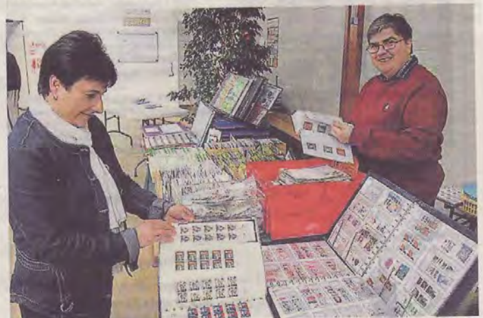
Des souvenirs philatéliques sont mis en vente.

90 villes françaises, dont Challans, invitent le public à découvrir la philatélie ce week-end. Ici, cette Fête du timbre, qui a débuté samedi, se déroule au Petit-Palais. Cette année, le thème de la fête est le tango et la danse contemporaine.