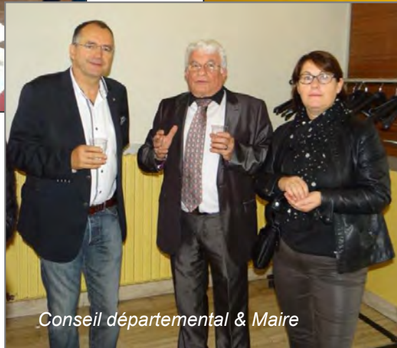
Conseil départemental & Maire

Parmi les nombreux stands, l'un des plus animés est peut-être celui de la section jeunesse.