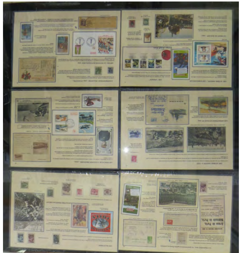
Théo MONTULET (Coulonges), La Grande Guerre 14-18 (hors compétition Beauvoir s/Niort)