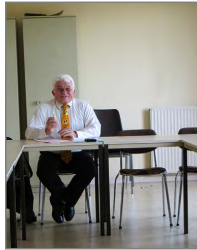
Un auditeur attentif !