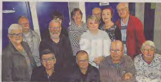
L'association philatélique et cartophile challandaise proposera de nombreuses animations autour du timbre.

Bouger en Vendée. 90 villes françaises, dont Challans, invitent le public à découvrir la philatélie.