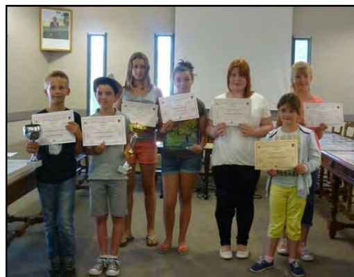
Les jeunes récompensés avec leurs diplômes