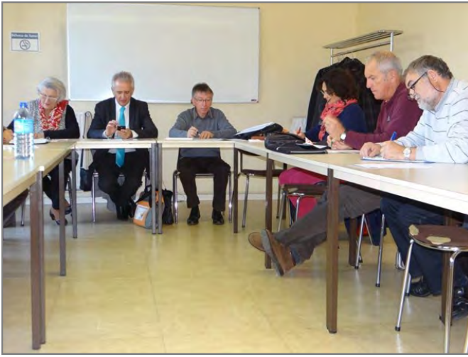
Prise de notes !