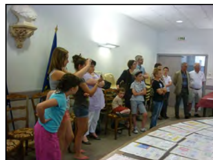
Parents et enfants pendant la remise des récompenses.