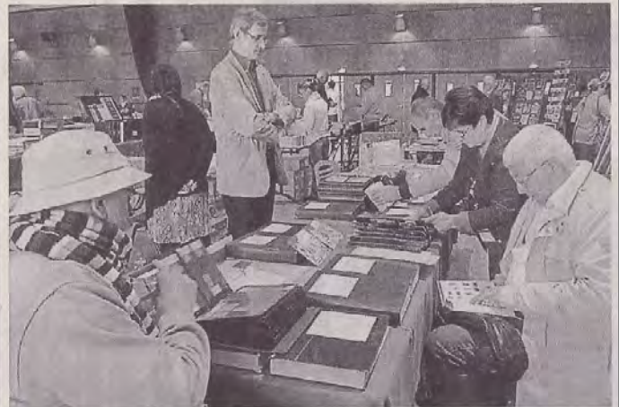
Exposants et chineurs, ont trouvé leur bonheur au Salon des collectionneurs de l'Amicale philatélique.

L'Amicale philatélique luçonnaise organisait, dimanche 4 octobre, son 27 e Salon des collectionneurs, salle Plaisance. « Avec une quinzaine d'exposants et 350 visiteurs, ce salon a été une totale réussite », exulte Maurice Bernier, président de l'Amicale philatélique.