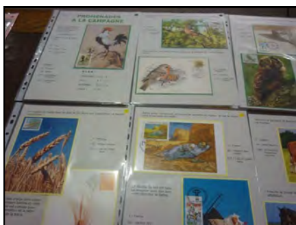
Une des collections primée.