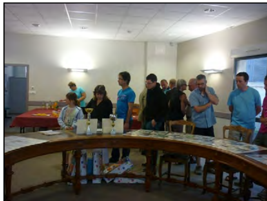
Les parents sont venus avec leurs enfants. Parents et enfants pendant la remise des récompenses.